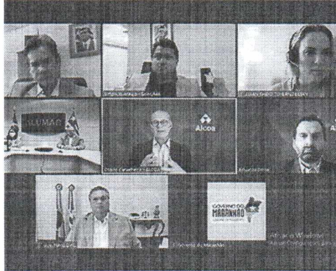
Anúncio foi feito em reunião com membros do governo e representantes da Alumar/Alcoa

O investimento foi anunciado após o governador Hívio Dino, os