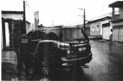
FORAM CUMPRIDOS MANDADOS EM SÃO LUÍS, PINHEIRO E SÃO JOSÉ DO RIBAMAR

As investigações tiveram início com base em notícia crime apresentada pela Caixa Econômica Federal, que informava sobre supostas fraudes em 150 contas de órgãos municipais de todo o Brasil.